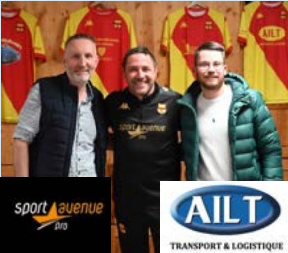
Les équipements EDUCATEURS/BENEVOLES sponsorisés par "AILT" et "SPORT AVENUE"