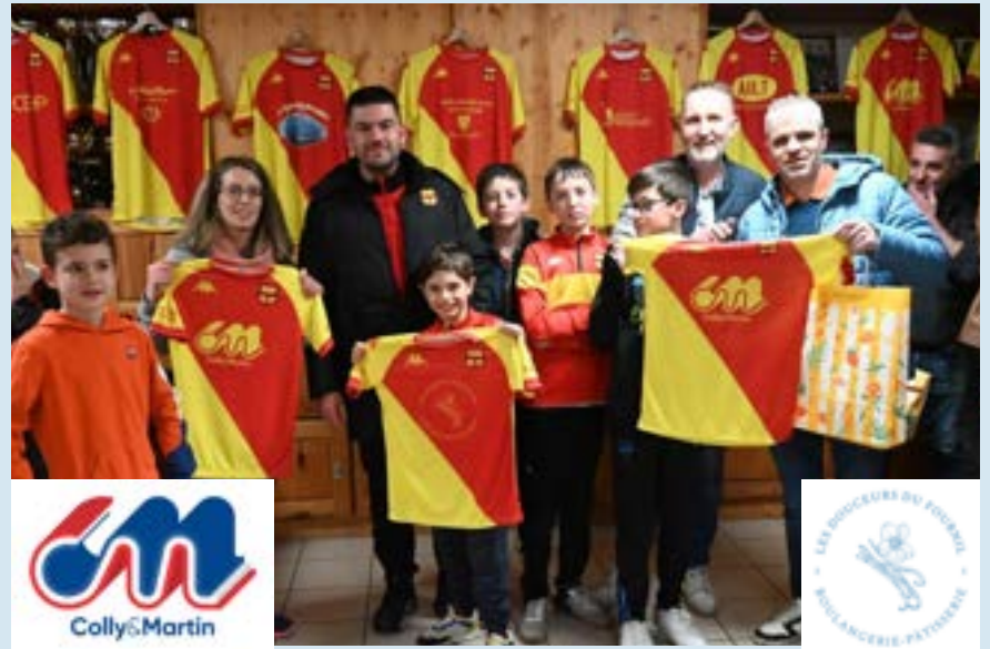
Les équipements U10-13 sponsorisés par "COLIS MARTIN" et la "BOULANGERIE LES DOUCEURS DU FOURNIL"

Ce rassemblement était aussi l'occasion de remettre aux éducateurs et bénévoles les nouveaux équipements (ensemble pour les Educateurs et Dirigeants et sweat pour les Esprit-Club et dirigeant bénévole.