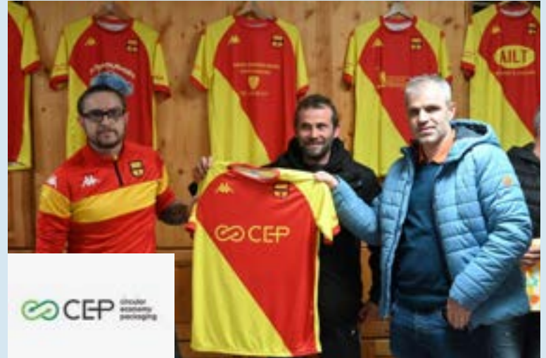
Les équipements LOISIRS sponsorisés par "CEP"