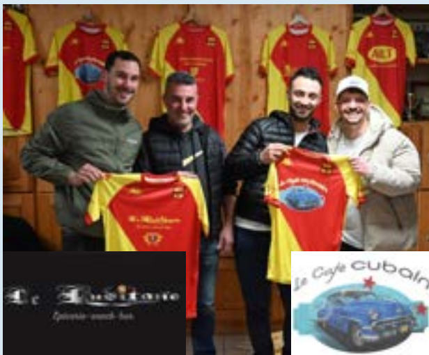
Les équipements SENIORS sponsorisés par "LE CAFE CUBAIN" et "LE LUSITANO"