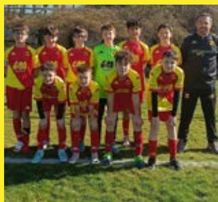
Le groupe U12-13 A aux Villettes.