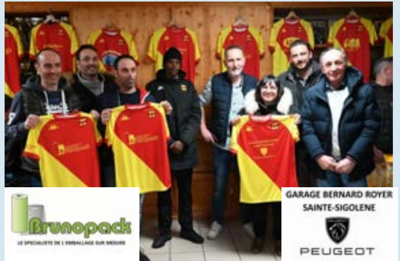
Les équipements U16-17-18 sponsorisés par "BRUNOPACK" et "GARAGE PEUGEOT"