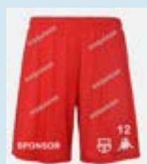
Les nouveaux shorts

Un grand MERCI à tous nos sponsors, à la municipalité, à Tonio pour les photos, à "La Commère" ainsi qu'à tous les participants.