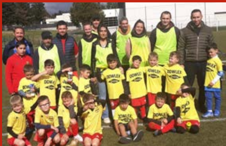
En mode "Animation Plateaux du Samedi" avec les autres parents.