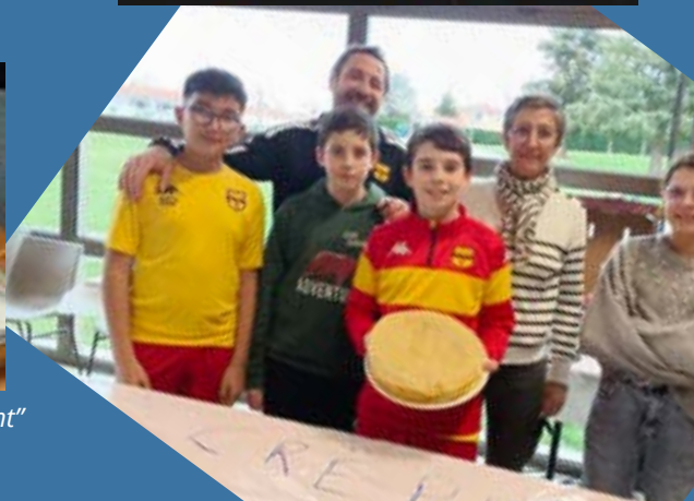
"Contribuer à apprendre la valeur du travail à travers des actions d'auto-financement"