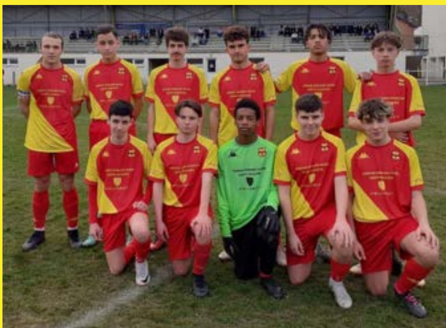
L'équipe U18 à Bas en Basset.