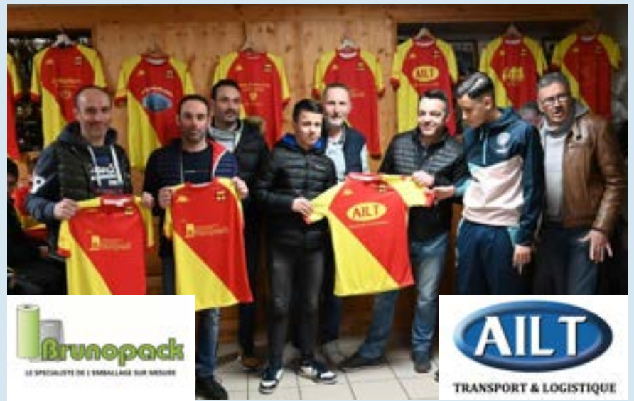
Les équipements U14-15 sponsorisés par "BRUNOPACK" et "AILT"

Un moment convivial qui s'est conclu par le traditionnel verre de l'amitié offert par le club.