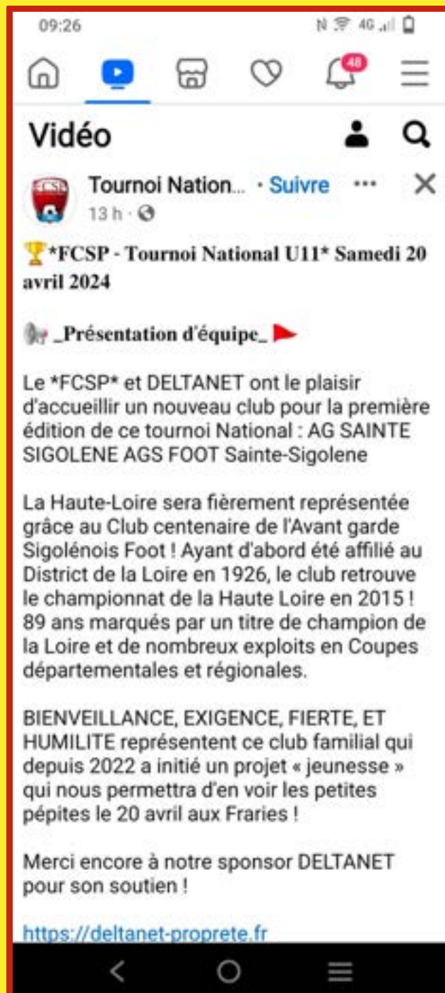
Présentation de l'AGS sur le compte Facebook du tournoi.