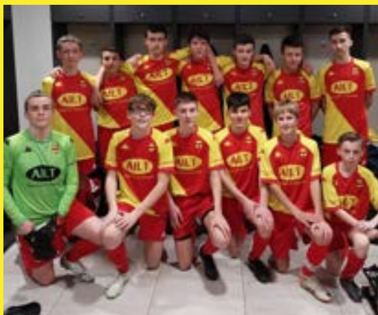
Le groupe U15 D1.