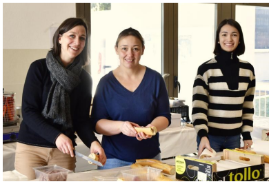
Merci à Tonio pour ces belles photos (disponibles sur le site internet, rubrique photos/vidéos)

2 jours de tournois, 32 équipes venues de Loire et Haute-Loire, près de 200 joueurs(euses) accueillis(es), des participants ravis de leurs tournois, des U12-15 impliqués dans l'animation et l'arbitrage, des parents au top à l'organisation, une équipe technique municipale impliquée: Du foot comme on l'aime !!!