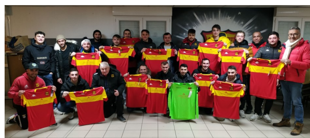
La réception des nouveaux maillots avec le groupe Senior.

Les nouveaux maillots accompagneront le groupe B qui vise le haut de tableau dans sa poule de D4.