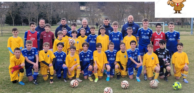
PPFU12: Lors d'une action de détection opposant une sélection U12 aux U13 des Sauveteurs Brivois.