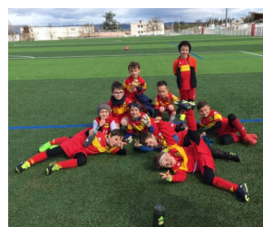
La Team U6-7 AGS Foot

2 équipes U6-7 avaient répondu à l'invitation des copains de Monistrol lors d'un samedi libre. Bravo aux parents qui ont encadré et merci au club de Monistrol pour l'invitation et l'accueil.