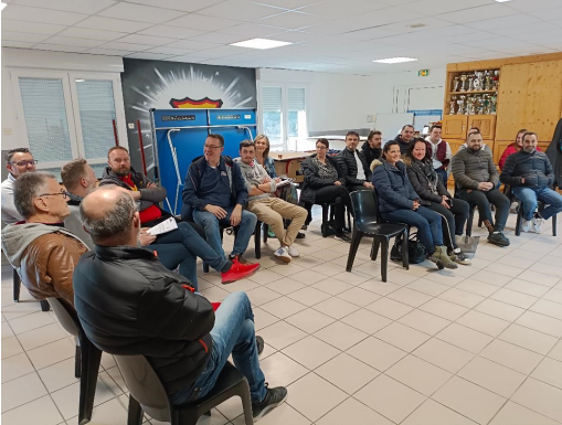
Une belle Fête des Enfant et du Club se prépare.