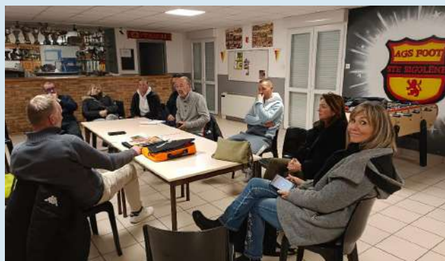
Réunion du mercredi 20 novembre.

ON RECRUTE !!! Si vous êtes intéressés n'hésitez pas à contacter Cédric CHALENCON.