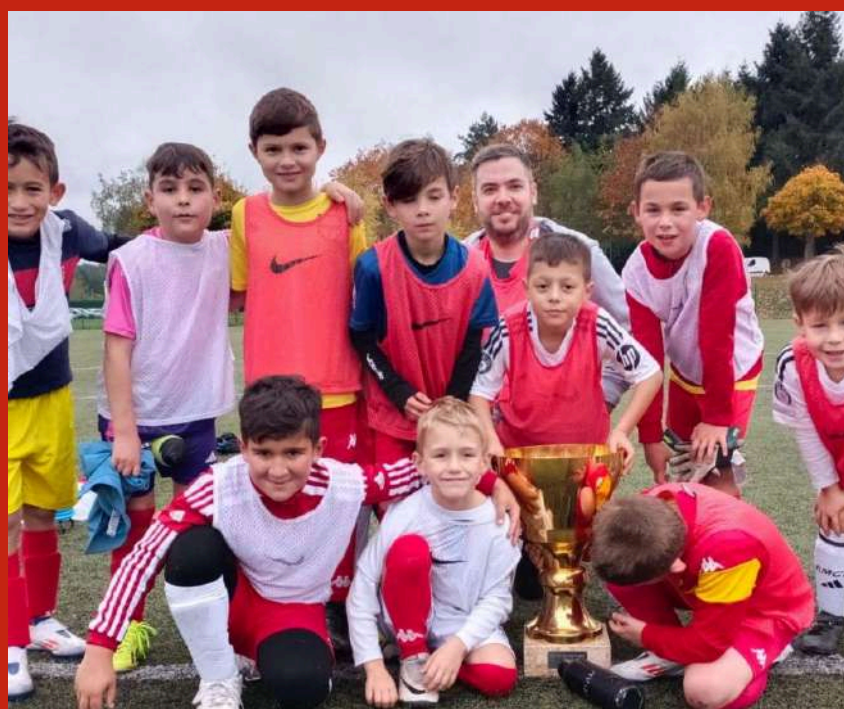
La Team U8-9 une bonne bande de copains sur et en dehors du terrain.