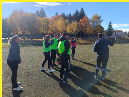
Mise en pratique lors d'une séance terrain.