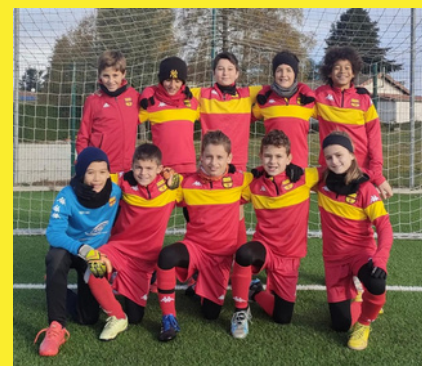
Le groupe A lors du Plateau à HPV

Le groupe A, composé principalement de 2e année, est maintenant en mesure de proposer un jeu cohérent. Le groupe B, composé d'une majorité de 1ere année découvre le jeu sur 1/2 terrain, les progrès sont significatifs et se voient semaine après semaine. Le groupe C, formé en partie de joueurs débutants le foot, rencontre logiquement des difficultés mais l'état d'esprit des joueurs nous laisse envisager de belles choses pour la suite. Un entraîneur responsable de l'équipe les samedis serait un vrai plus. L'appel est une nouvelle fois lancé ;)