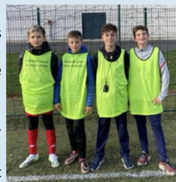
Les Team "Apprenti-coachs" U10-11 et U12-13 de la période Novembre/Décembre.