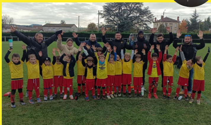
Les groupes U6-7 au Plateau de Bas en Basset

LES PLATEAUX U8-9 : Plateaux District à Aurec et Yssingaux (Jeux et oppositions) et Plateau Matches à St Pal de Mons. Une progression constante de tous les joueurs techniquement et un esprit collectif de plus en plus développé. Bravo et merci aux parents encadrants, aux parents supporters ainsi qu'aux clubs d'Aurec, Yssingaux et St Pal de Mons pour le très bon accueil.