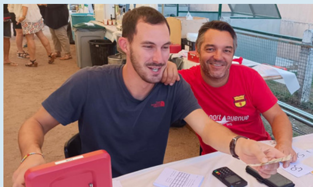
La Team bénévoles a encore assuré (mille excuses pour ceux qui ne sont pas sur les photos)