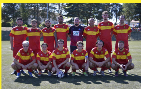
La Réserve au top en Coupe doit passer la vitesse supérieure pour accrocher le bon wagon en championnat.