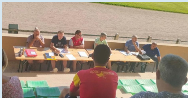
Bilan de la saison écoulée et perspectives à venir ont été présenté à l'assemblée.

L'AGS lançait sa saison samedi 9 septembre avec son AG le matin suivi d'un barbecue offert par le club et en parallèle du 1er tour de la Coupe Gambardella et du traditionnel Concours de Pétanque. Une très belle journée conviviale et chaleureuse comme on les aime. La saison est lancée sur de bonnes bases !