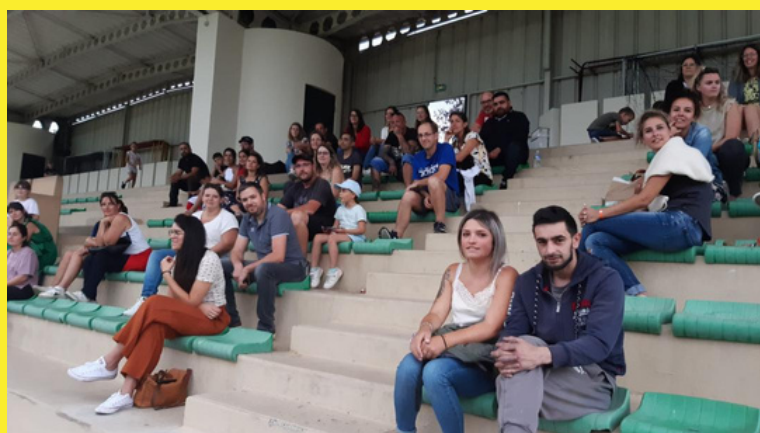
Réunion d'information à destination des parents U6-9