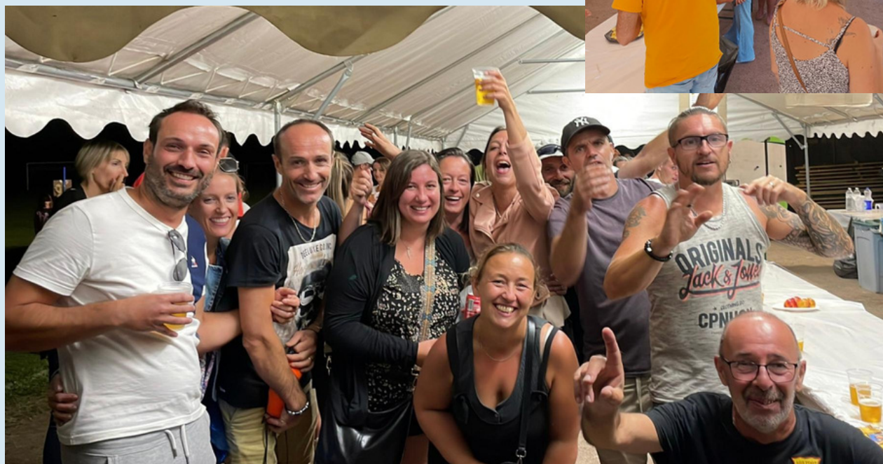
Plaisirs et bonne humeur était au rendez-vous !