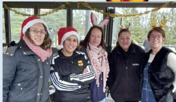
Une équipe "Esprit-Club" au TOP !