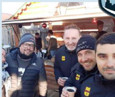
La délégation Golénoise. au marché de Noël du Puy.