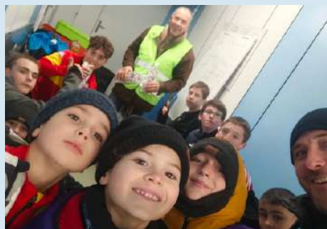
Pause casse-croûte à la mi-temps.