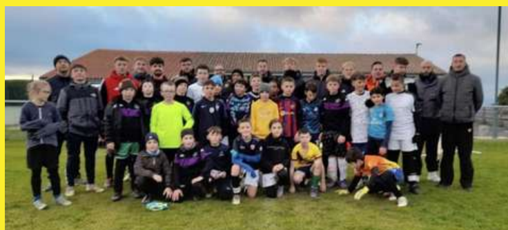
Formation CFI U10-13 à Grazac.