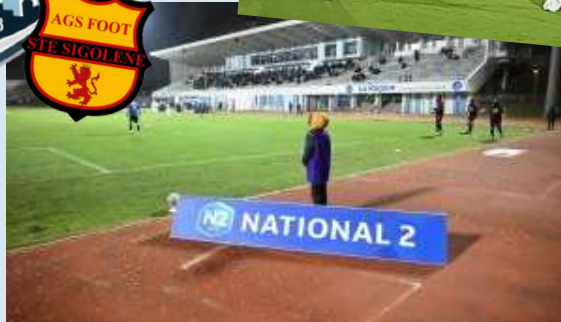
Porte-drapeaux et ramasseurs de balle: une sacré expérience.

Après le match des U13 au stade Massot (synthétique), la délégation Golénoise était invitée à participer au match de National 2: Le Puy Foot 43 - AS Cannes.