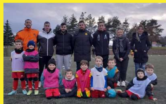
Formation U6-9 à Ste Sigolène.