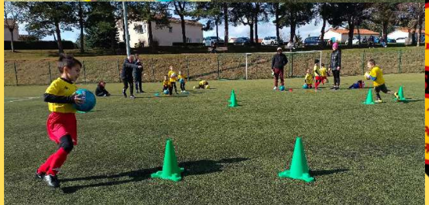
"Je découvre le maniement du ballon à travers des petits jeux ludiques"

U6-7 PLATEAU DISTRICT à Ste Sigolène. SAMEDI 22 MARS