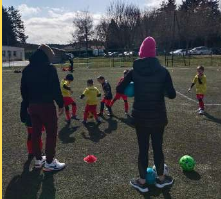
L'encadrement avec les parents. Un vrai BONUS pour les enfants.