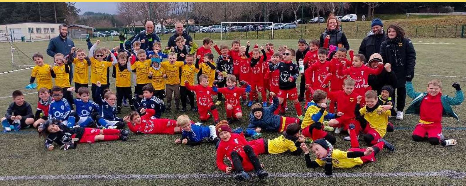
Toujours un plaisir d'organiser des plateaux avec des encadrants passionnés et bienveillants. Plateau District U6-7, samedi 22 mars 2025, Ste Sigolène.

Merci aux parents pour l'aide pour l'accueil et l'organisation.