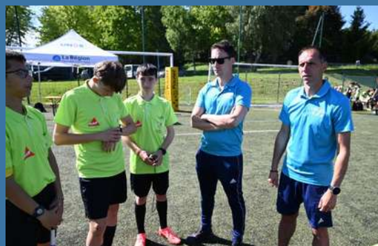
Les profs d'EPS de tout le département se sont mobilisés.