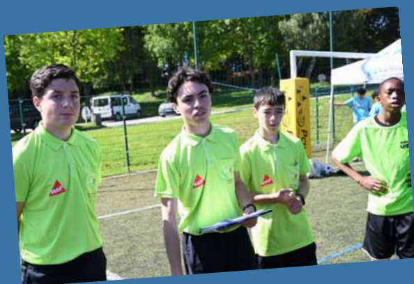
Les jeunes arbitres du département ont officié l'ensemble des matchs. Des prestations remarquées.