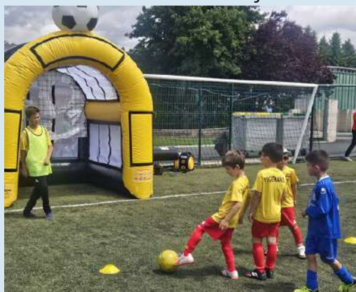
CHAPEAU aux U10-13 qui ont assuré l'animation des GRANDS JEUX