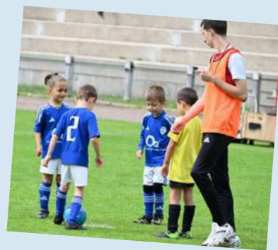
La Team arbitre U14-15 a assuré sur les 183 matchs de la journée.