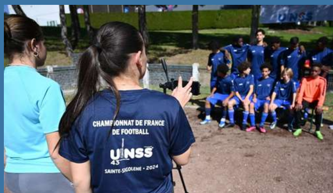
L'organisation était au top pour accueillir les 16 délégations venues de toute la France.