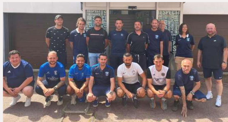
Animation terrain, formation des éducateurs, Coupe Pitch, JND, détections, sélection, CPS ... La Commission Technique est une vraie force pour notre District.