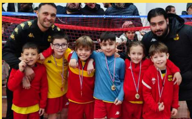
La Team Sang et Or à Cellieu (42)

Merci au club de Haut-Lignon pour l'accueil et l'organisation.