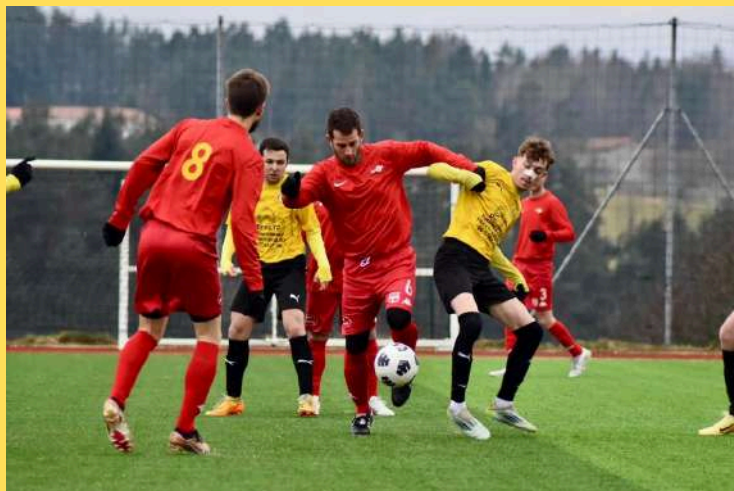
Derby acharné face à St Pal de Mons et qualification en Coupe.