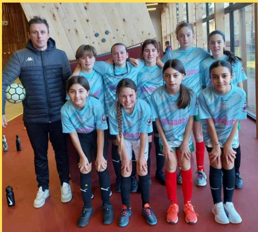
Les filles venant de divers horizons unies pour former une équipe du territoire

Avec le club de Grazac/Lapte qui pilote, l'AG Ste Sigolène est partie prenante pour aider au développement du Football Féminin sur le territoire: Les clubs accueillent les joueuses U6-11 en les mélangeant avec les garçons et le projet commun démarre en U12-13 avec des actions spécifiques (ouvertes à tous les clubs) menées tout au long de l'année. L'objectif ? Créer du lien, partager des bons moments, soutenir les initiatives qui visent à développer la pratique du football féminin sur notre territoire et essayer de monter des équipes filles à 11 en catégorie U14-15.