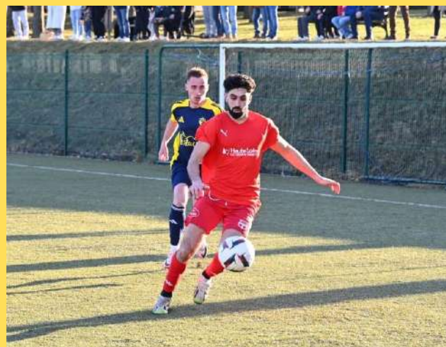
L'équipe fanion rate le coche face à l'USSL.